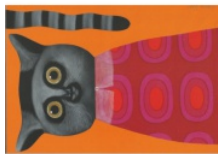
Illustrazione di Arianna Papini