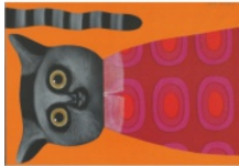
Illustrazione di Arianna Papini

Pauline Pinson, Magali Le Huche Pesce Chiappa